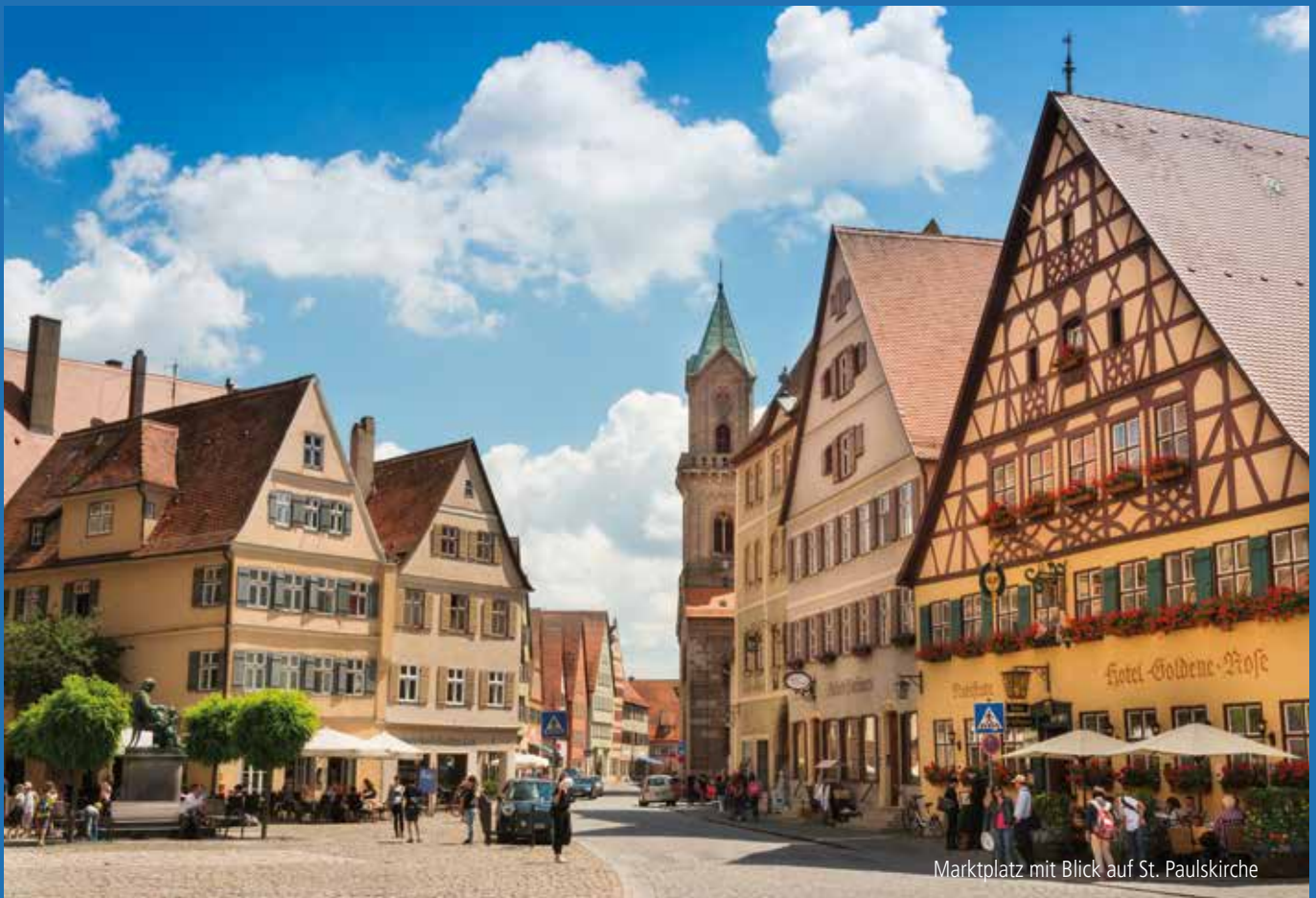
Marktplatz mit Blick auf St. Paulskirche