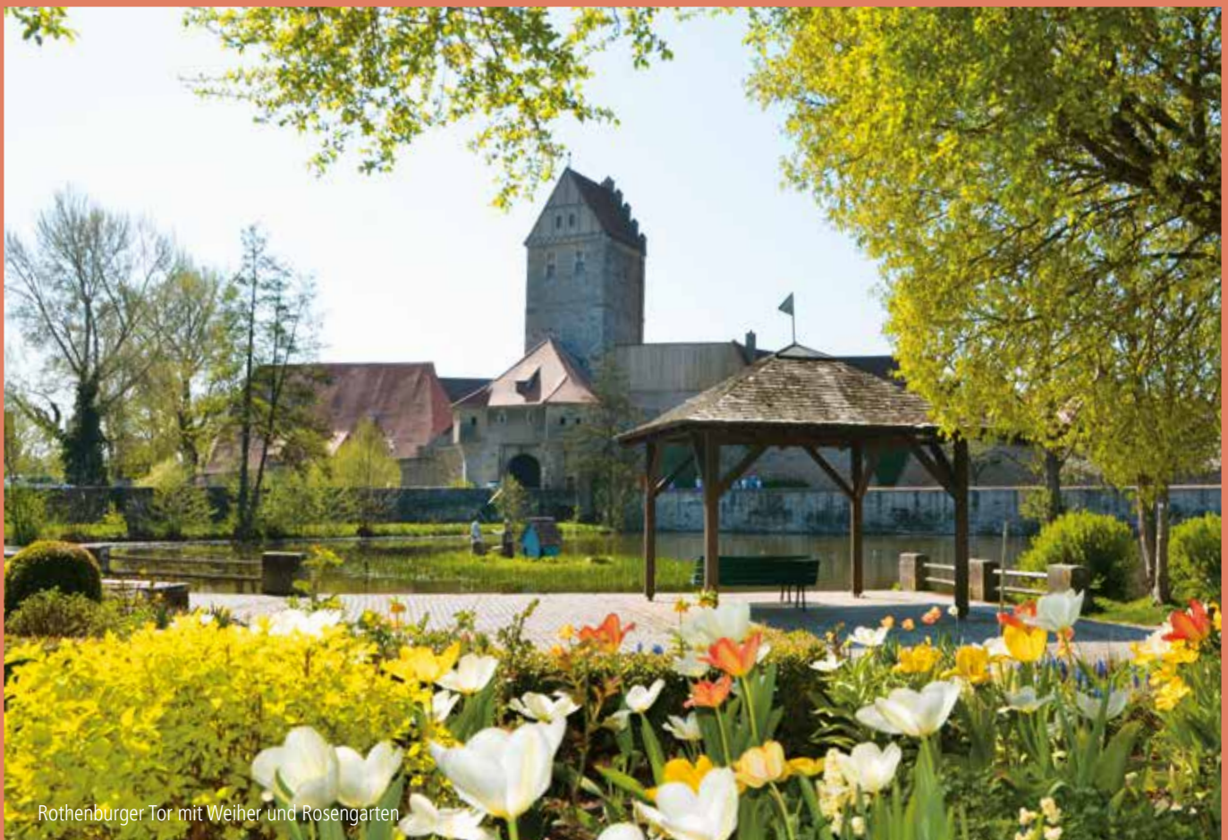
Rothenburger Tor mit Weiher und Rosengarten

Schäfergässlein 4 91550 Dinkelsbühl T: +49 (0) 171/9350660 info@pension-baumeisterhaus-dinkelsbuehl.de www.baumeisterhaus-dkb.de